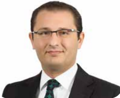
Av. Merter Özay