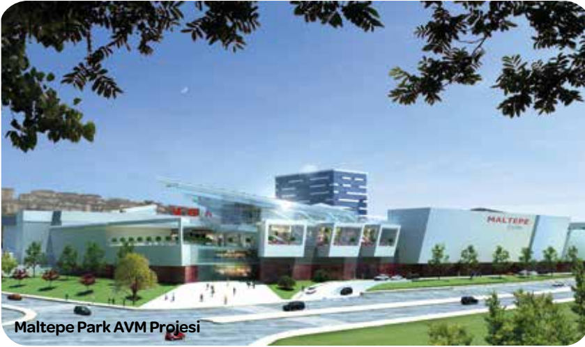
Maltepe Park AVM Projesi

CarrefourSA, perakendeci şapkasının yanı sıra alışveriş merkezi projelerine de yatırım yapmaktadır.